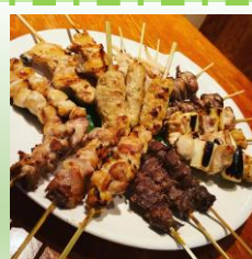
→お店が誇る一品の焼き鳥

四代目の自分はまだまだ未熟者ですが、先代達が築いてくれたお客様からの信頼をしっかりと引き継ぎ真面目に丁寧な仕事を心掛けて、時代に合わせた新たな店作りを挑戦していく所存ですので、これからも鳥勘をよろしく願います。