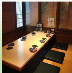
↑落ち着いた雰囲気 で飲める個室もあります

株式会社 鳥勘 住所：吉川市木売 1-7-11 良元ビル 2階 TEL：048-981-4924